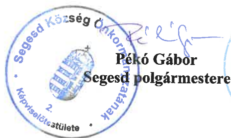
Pékó Gábor Segesd polgármestere